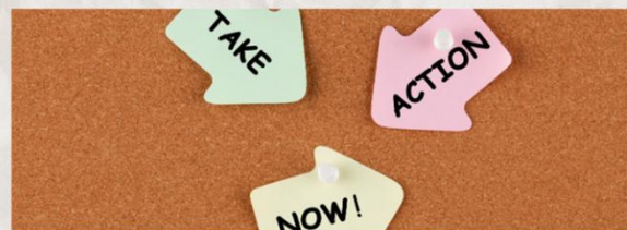
4- La Gazette de Belcaire