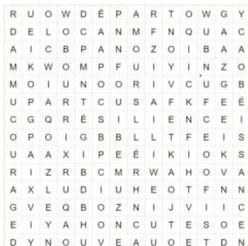
La grille des mots cachés